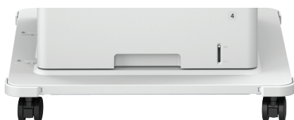
UNIDADE DE ALIMENTADOR DE PAPEL OPCIONAL UNIT-AV1 (até um adicional)